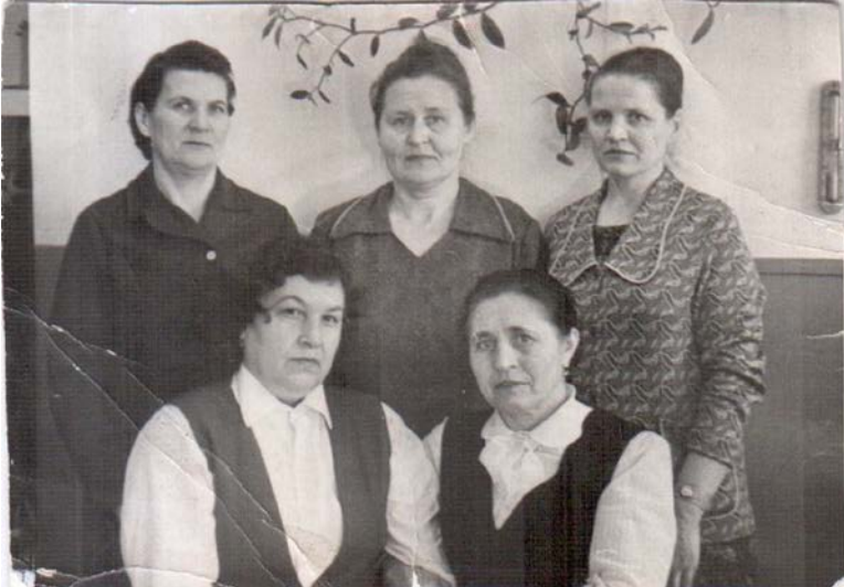
Больница, нач. 60-х.