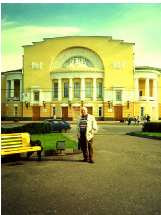
Город Льгов Курской области. Здесь в 1926 году родился Георгий Зубков.