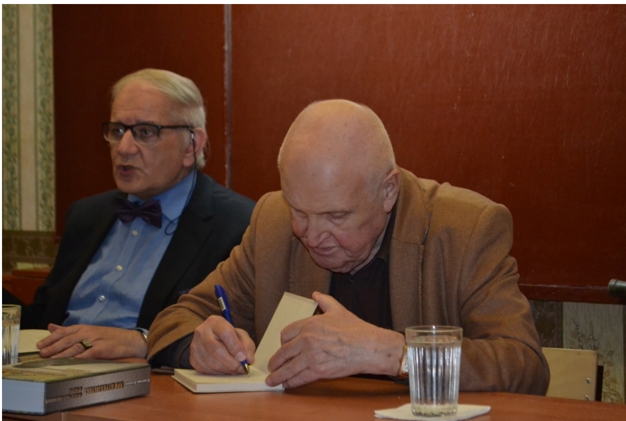
Книга на память