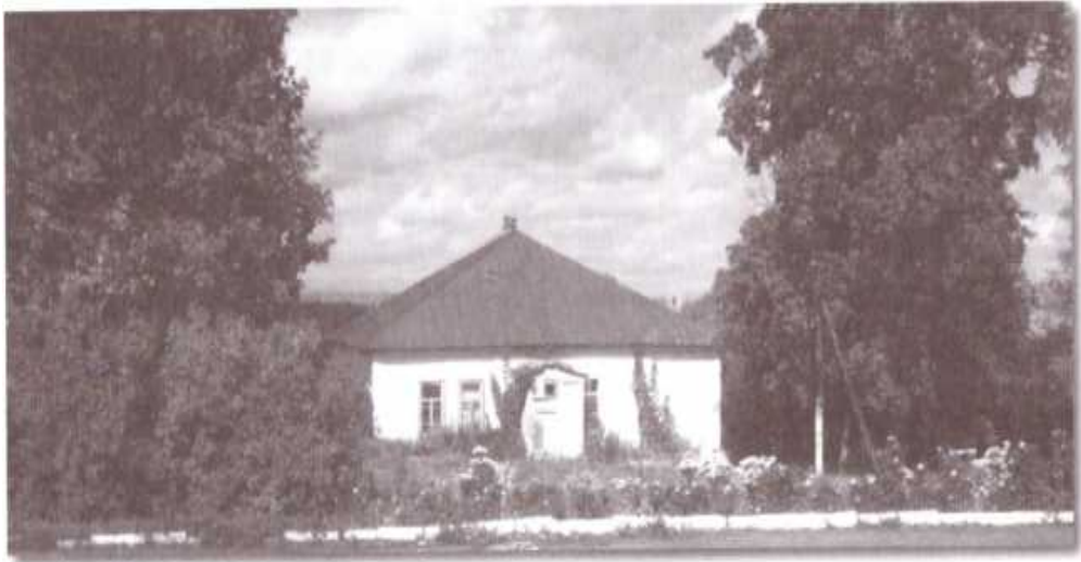
Дом Выходцевых в селе Волоконск