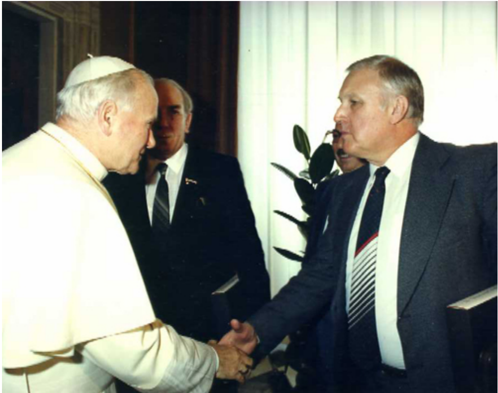
Встреча с Папой Римским. Ватикан, апрель 1986 г.